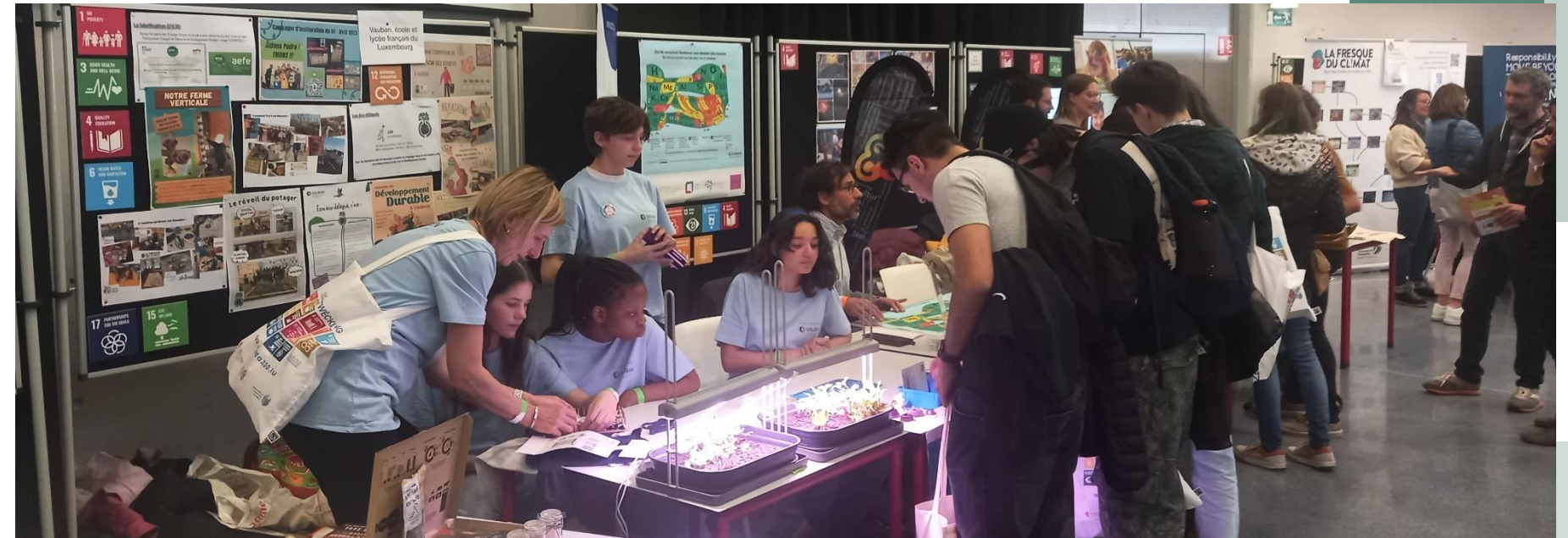
Stand de Vauban à la foire BNE – 20/04/23